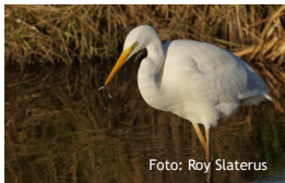
Egretta alba, Grote zilverreiger