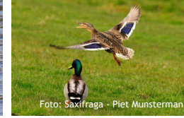
Anas platyrhynchos, Wilde eend