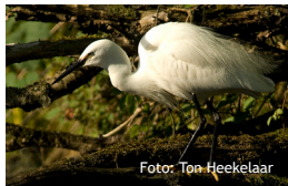
Egretta garzetta, Kleine zilverreiger