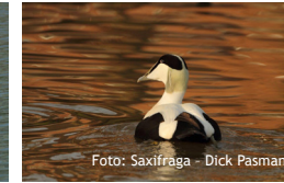
Somateria mollissima, Eider