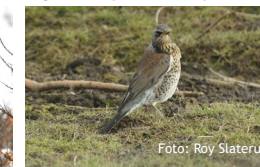
Turdus pilaris, Kramsvogel