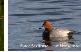
Aythya ferina, Tafeleend