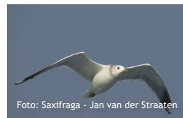
Larus canus, Stormmeeuw