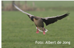
Anser brachyrhynchus, Kleine rietgans