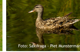
Anas strepera, Kraakeend