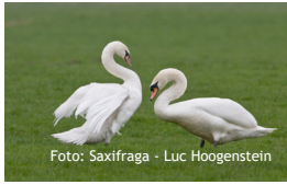
Cygnus olor, Knobbelzwaan