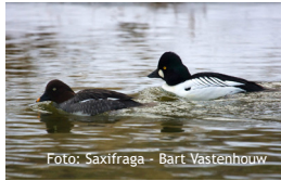
Bucephala clangula, Brilduiker