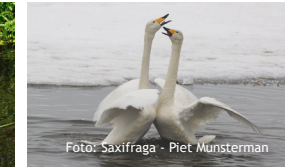
Cygnus cygnus, Wilde zwaan