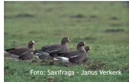
Anser erythropus, Dwerggans