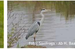
Ardea cinerea, Blauwe reiger