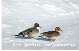
Anas acuta, Pijlstaart