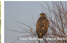
Buteo buteo, Buizerd