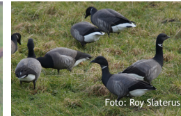
Branta bernicla, Rotgans