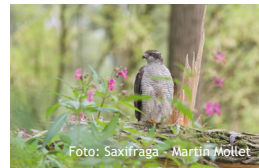
Accipiter gentilis, Havik