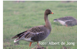
Anser fabilis fabilis, Taiga rietgans