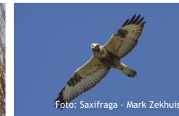
Buteo lagopus, Ruigpoot buizerd