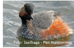
Podiceps nigricollis , Geoorde fuut