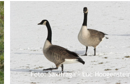
Branta canadensis , Grote Canadese gans