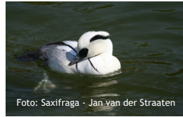
Mergellus albellus , Nonnetje