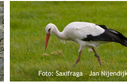
Ciconia ciconia, Ooievaar