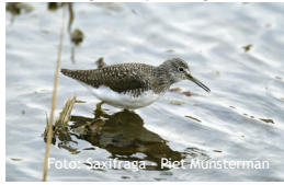
Tringa ochropus, Witgat