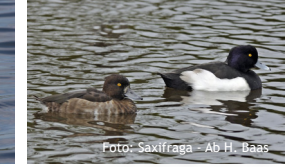
Aythya fuligula, Kuifeend