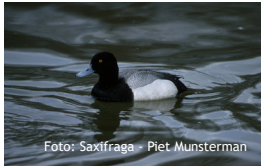
Aythya marila, Topper