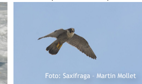
Falco peregrinus, Slechtvalk