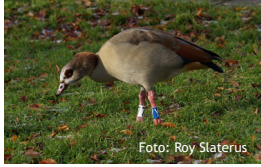
Alopochen aegyptiacus, Nijlgans