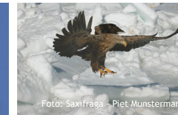
Haliaeetus albicilla, Zearend