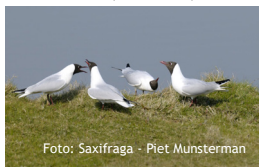
Chroicocephalus ridibundus , Kokmeeuw