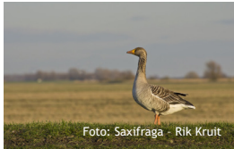
Anser anser, Grauwe gans