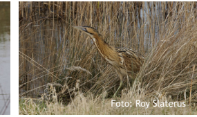
Botaurus stellaris, Roerdomp