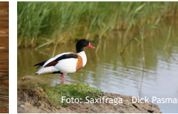
Tadorna tadorna, Bergeend