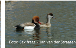
Netta rufina, Krooneend