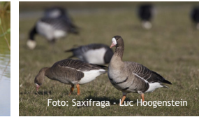
Anser albifrons, Kolgans