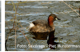
Tachybaptus ruficollis, Dodaars