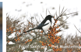
Pica pica, Ekster