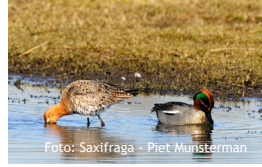
Anas crecca, Wintertaling