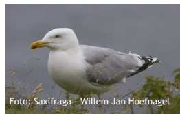
Larus argentatus , Zilvermeeuw