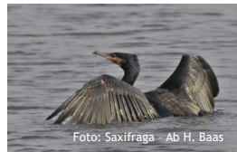
Phalacrocorax carbo, Aalscholver