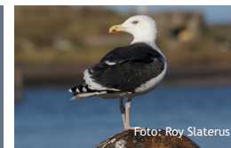
Larus marinus, Grote mantelmeeuw