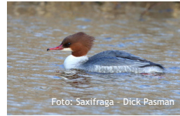
Mergus merganser, Grote zaagbek