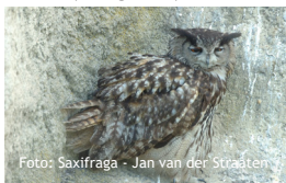
Bubo bubo, Oehoe