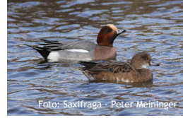
Anas penelope, Smient