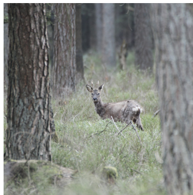
24 maart 2020: rode haar begint beetje door te komen