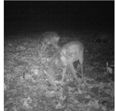
2 februari 2020 de uitbreiding is goed te zien