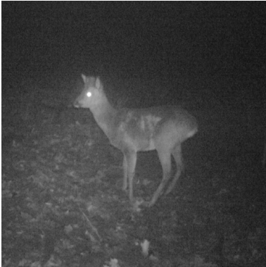
21 januari 2020: eerste plek zichtbaar