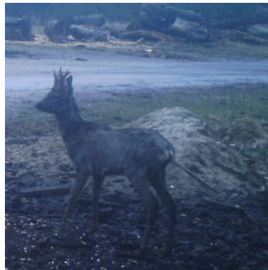
8 maart 2020: gewei geveegd, zo goed als kaal