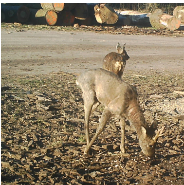
21 maart 2020: Ook de andere kant is bijna geheel 'kaal'.