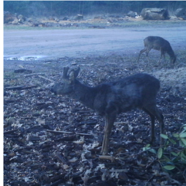
1 februari 2020: de plek is groter geworden