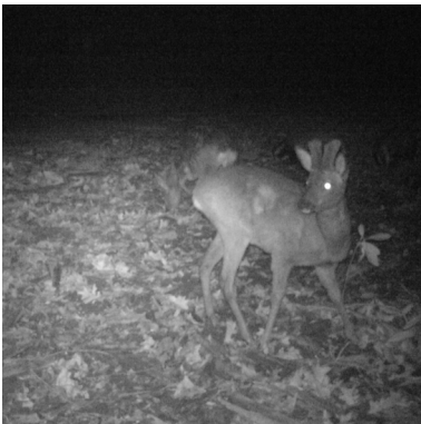
2 februari 2020: De andere kant van de reebok