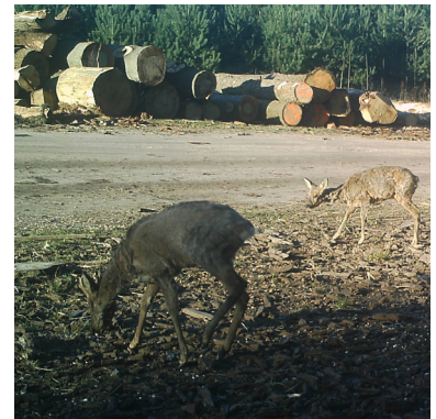
21 maart 2020: bok heeft alleen nog een wat haar op de rug; de geit heeft normale verharing.