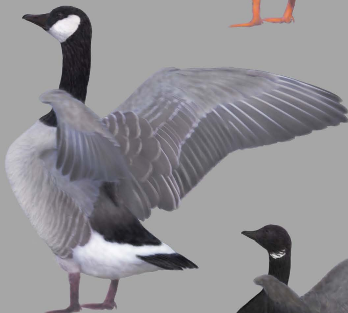
Grote Canadese Gans

Hybridisatie tussen verschillende gansensoorten treedt regelmatig op. Maak bij twijfel foto's!