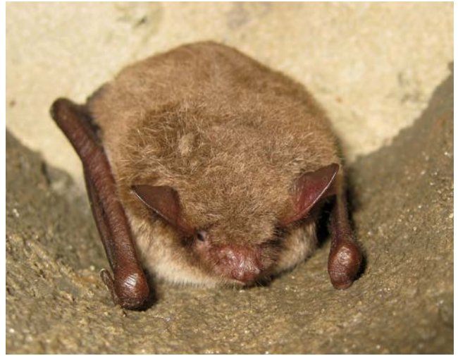
Watervleermuis ( Myotis daubentonii )

Afdeling DSU/Rabiës Houtribweg 39 8221 RA Lelystad